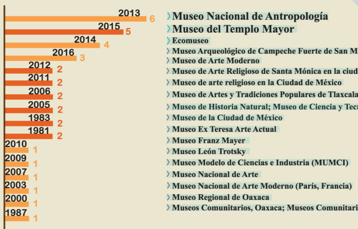
TESIS POR AÑO

3) Esta herramienta está diseñada para actualizarse una vez que cada estudiante haya concluido su tesis de grado.