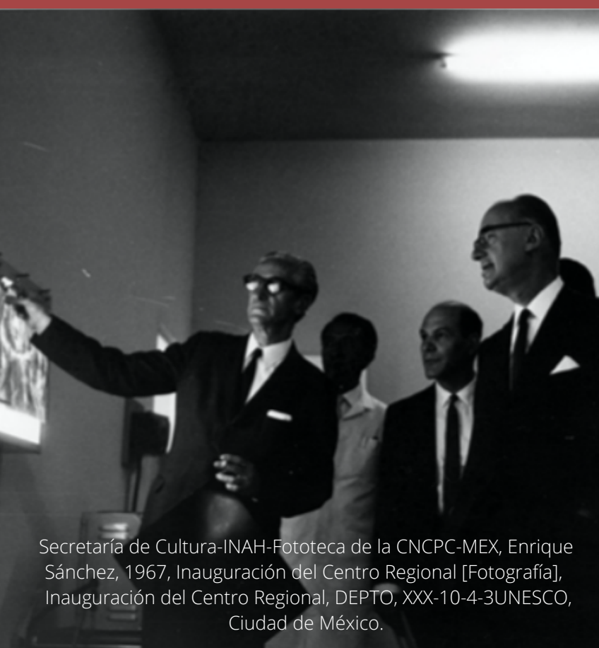
Secretaría de Cultura-INAH-Fototeca de la CNCPC-MEX, Enrique Sánchez, 1967, Inauguración del Centro Regional [Fotografía], Inauguración del Centro Regional, DEPTO. XXX-10-4-3UNESCO, Ciudad de México.

El CERLACOR se creó a partir de un acuerdo entre el Gobierno de México y la UNESCO (1967-1976) para la formación de técnicos en conservación de bienes culturales de América Latina y el Caribe. En 1972 se firmó un segundo acuerdo con la Organización de Estados Americanos (OEA) para impartir cursos interamericanos de capacitación museográfica, más otro de restauración de bienes culturales, conocidos como cursos o becarios OEA.