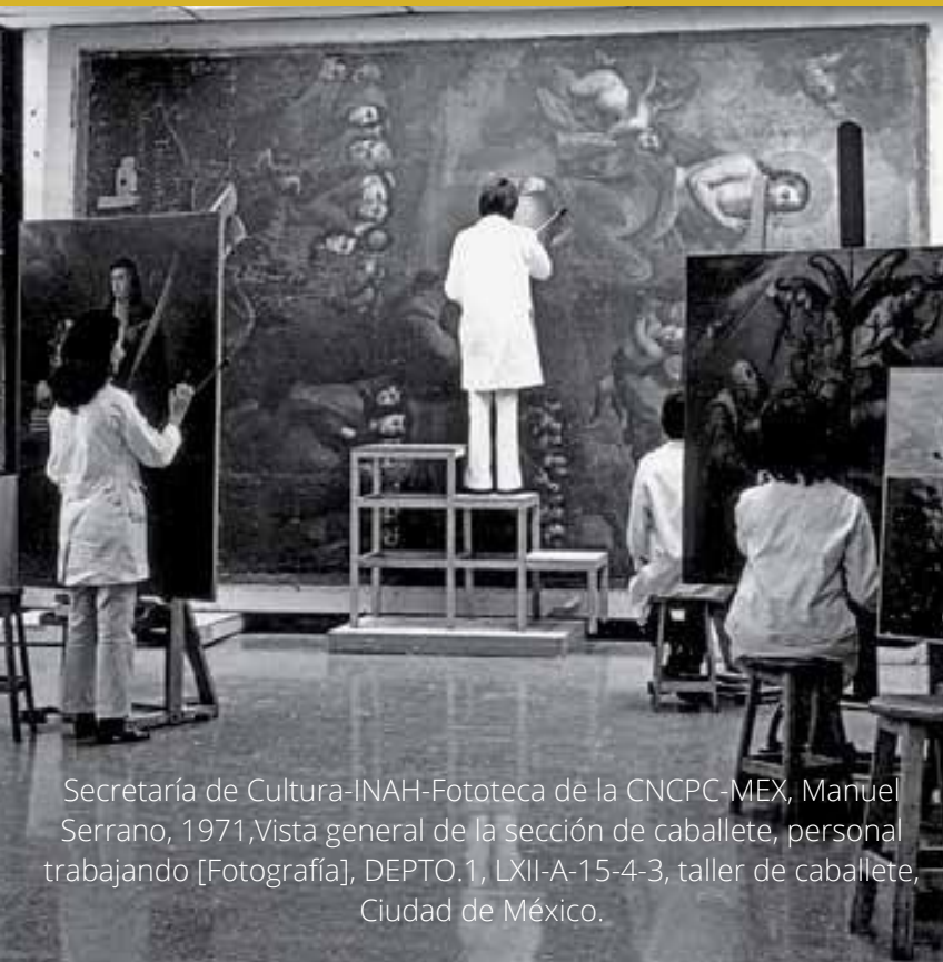
Secretaría de Cultura-INAH-Fototeca de la CNCPC-MEX, Manuel Serrano, 1971, Vista general de la sección de caballete, personal trabajando [Fotografía], DEPTO.1, LXII-A-15-4-3, taller de caballete, Ciudad de México.