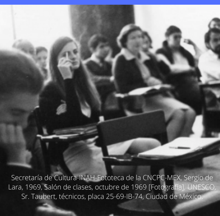
Secretaría de Cultura-INAH-Fototeca de la CNCPC-MEX, Sergio de Lara, 1969, Salón de clases, octubre de 1969 [Fotografía], UNESCO, Sr. Taubert, técnicos, placa 25-69-IB-74, Ciudad de México.

El Centro de Estudios para la Conservación de Bienes Culturales Paul Coremans se inauguró en 1966 para impartir un Curso intensivo de conservación. Ahí mismo, en 1968 se ofertó el primer programa de 4 años para conservadores en México. Tiempo después, se convirtió en la licenciatura en restauración de la ENCRyM, cuya finalidad era atender las necesidades del INAH. Hoy la Escuela continúa con su labor formando especialistas de conservación, restauración y museología.